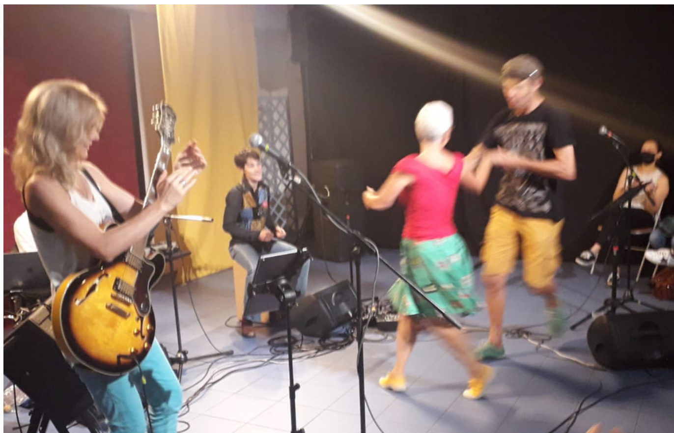
Première du spectacle le 18 septembre 2021 à la MVAC Paris 15

Sister Rosetta Tharpe, un modèle inspirant pour les générations d'aujourd'hui